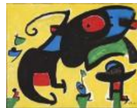
Joan Miró. Personnages et oiseaux dans un paysage nocturne, 1978 Oli sobre tela Fundació Joan Miró, Barcelona